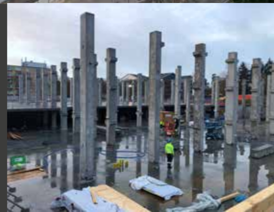
Färsk bild från bygget.